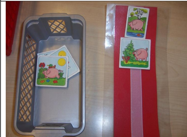
F - 3. Íslenska-annað