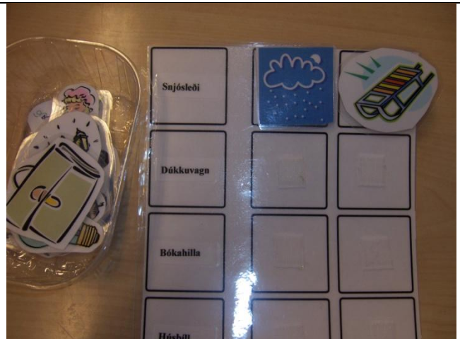
F - 4. Íslenska-annað