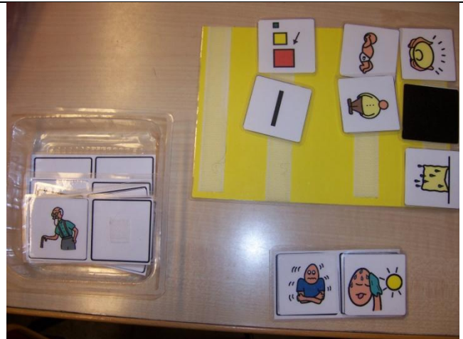
F - 2. Íslenska-annað