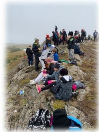
Gönguferð í Krossanesborgir