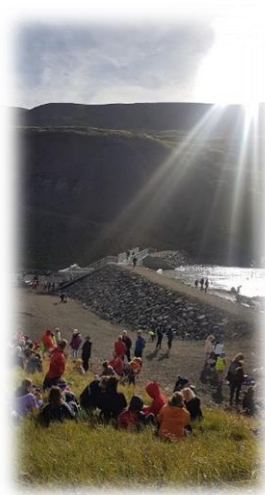
Gönguferð á Glerárdal